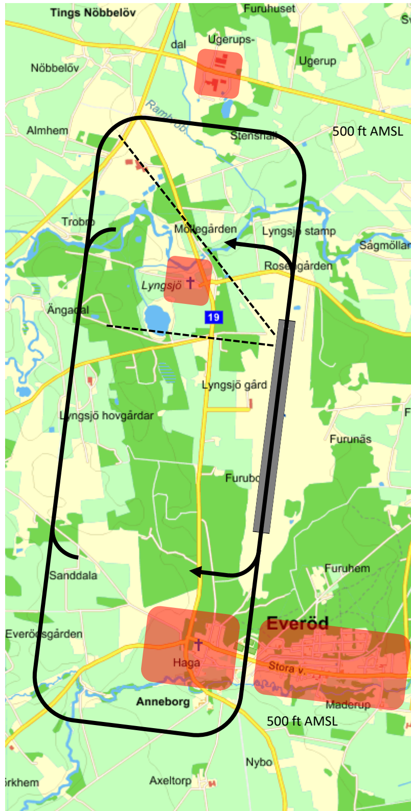
Normal landning – 800 ft AMSL